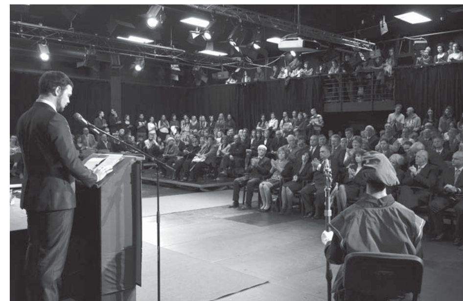
Pohľad do divadelnej sály